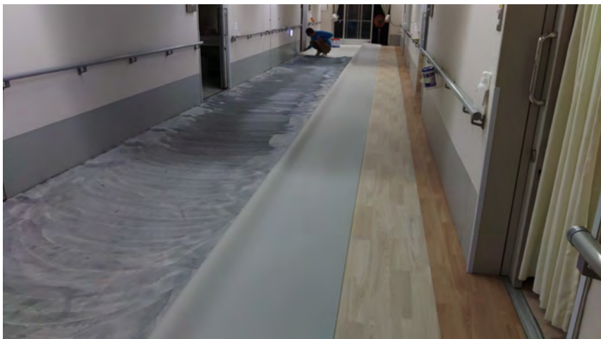
上張りシート施工状況 2024. 3. 24