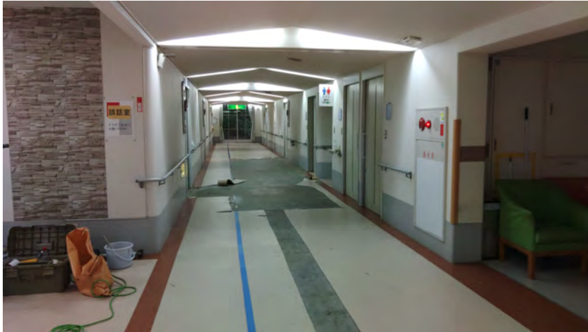
既存シート剥ぎ状況 2024. 3. 23