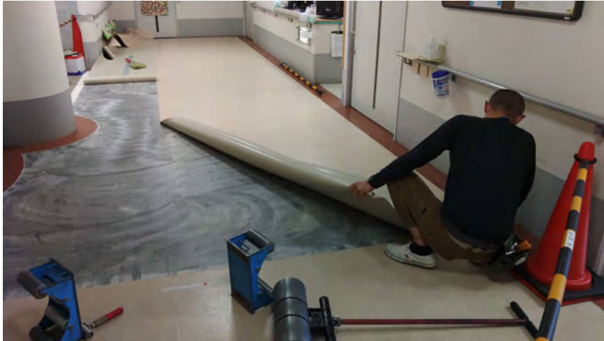
上張りシート施工状況 2024. 3. 27