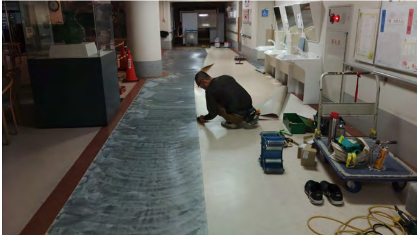
上張りシート施工状況 2024. 3. 28~29