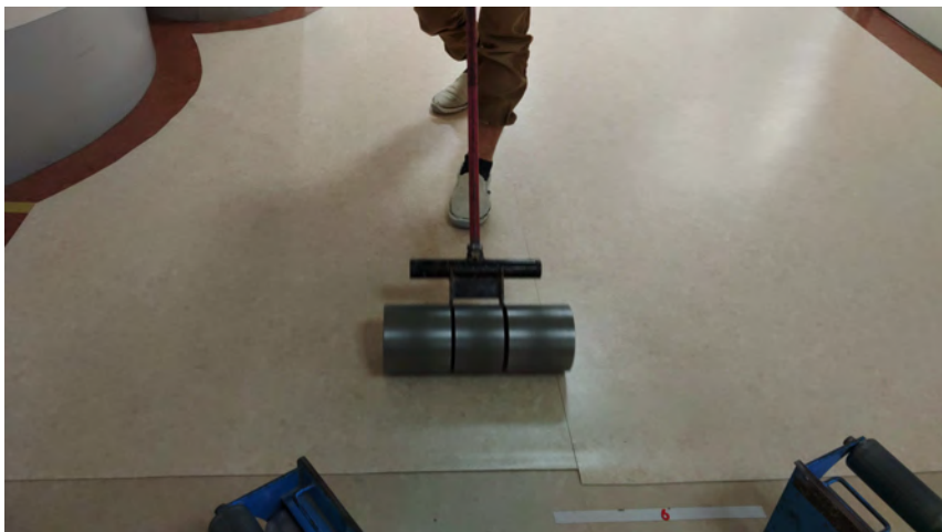
上張りシート施工状況 2024. 3. 27