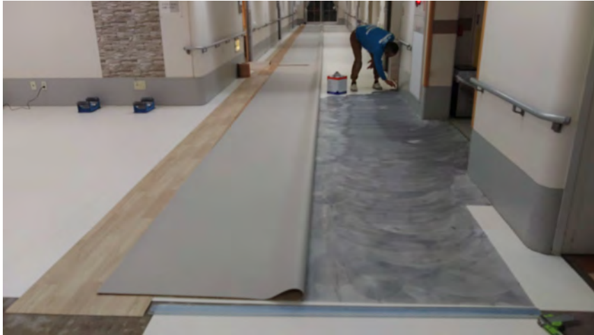
上張りシート施工状況 2024. 3. 24