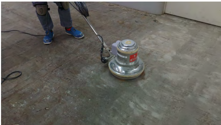
下地調整状況 2024. 3. 23