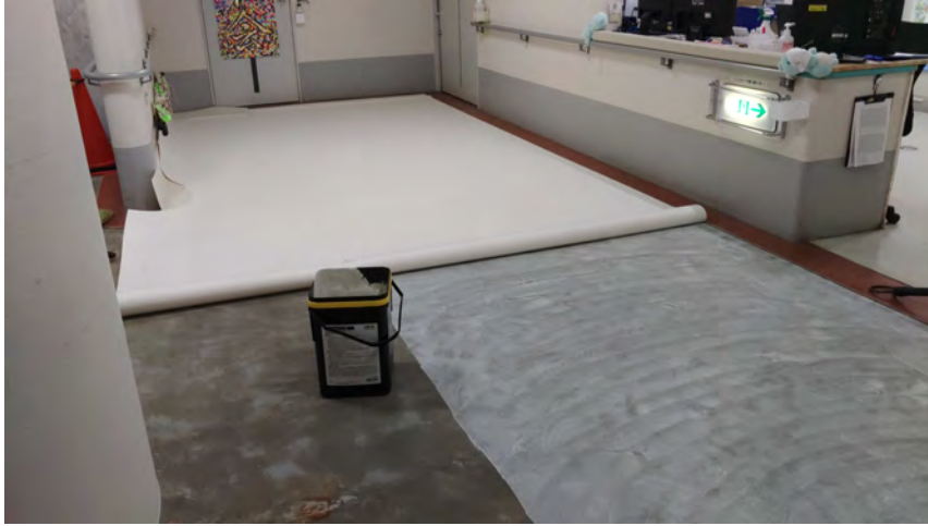
下張りシート施工状況 2024. 3. 27