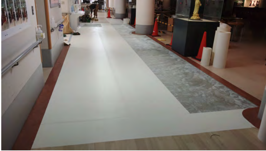
下張りシート施工状況 2024. 3. 28~29