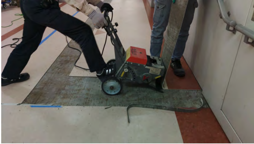
既存シート剥ぎ状況 2024. 3. 23