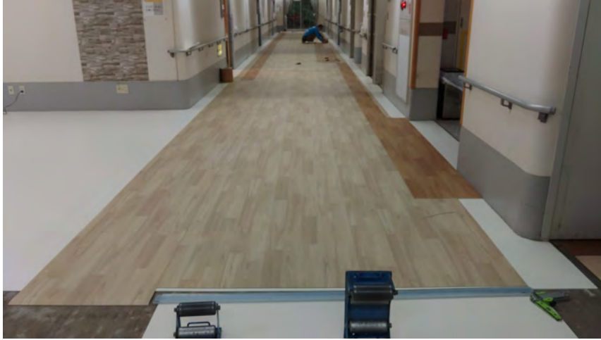
上張りシート施工状況 2024. 3. 24