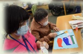
季節の作品制作 「5月鯉のぼり」