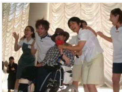
H20.3.29 H19年度締めくくりとなる合同家族会を桜の花が満開に咲き誇る中で開催。ご利用者のご家族と職員で多くの意見交換ができました。