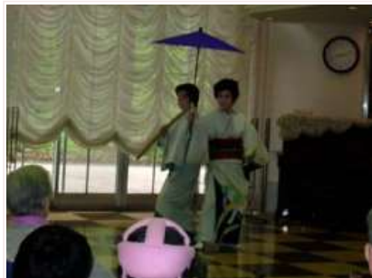
H20.6.4 第一回のご自慢大会開催 入所のゲストも通所のゲストも生き生きとされ、楽しいひとときを過ごしていただきました。