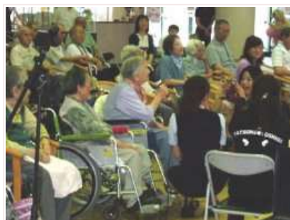
H20.6.18 日本舞踊のご一行が来設され、色々な踊りを踊っていただき、ゲストの皆様も盛り上げていただき高評でした。